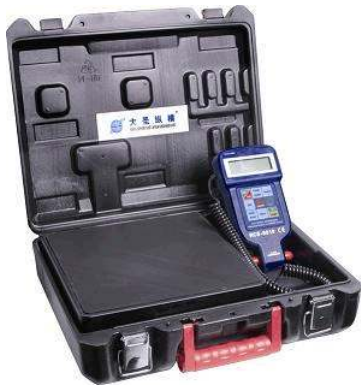
RCS-9020 BALANZA DIGITAL PROGRAMABLE PARA CARGA