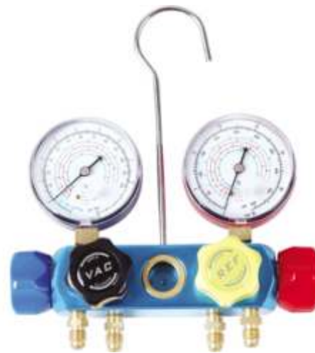
CT-4 SISTEMA ANALIZADOR DE 4 VIAS

SISTEMA DE VALVULAS CON CIERRE POR DIAFRAGMA QUE ELIMINA LOS ERRORES DE MEDICION. NO INCLUYE LAS MANGUERAS CUERPO DE ALUMINIO CON VISOR Y SOPORTES PARA LAS MANGUERAS