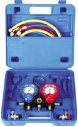
DS-MC01 MANIFOLD R-134a COMPLETO CON ACOPLES

INCLUYE TRES MANGUERAS DE 1.50 MTS + PROTECTORES + ACOPLES R-134 AUTOMOTOR MALETIN PLASTICO INCLUIDO