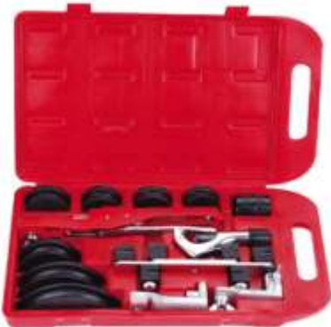
CT-999R DOBLADORA UNIVERSAL TIPO BALLESTA 3/8 " A 7/8"