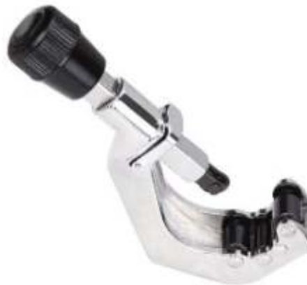
CT-206 CORTADORA INDUSTRIAL 3/8" A 2 5/8"