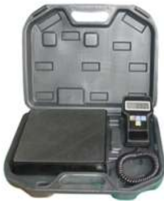
RCS-7020 BALANZA DIGITAL PARA CARGA