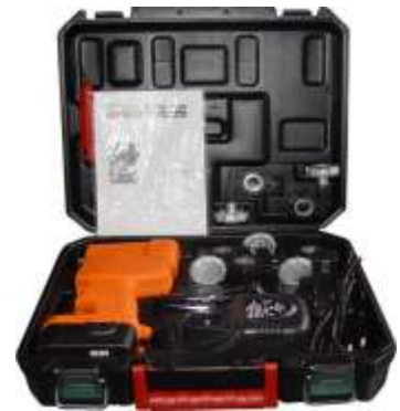
CT-E800 PESTAÑADORA ELECTRICA INALAMBRICA