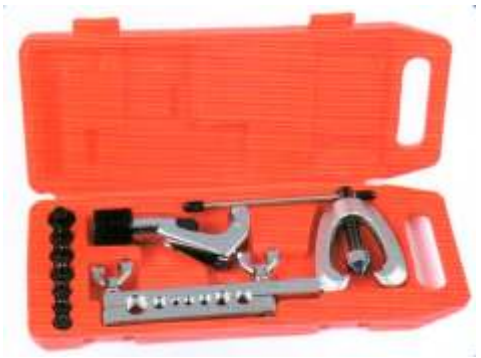
CT-96FB PESTAÑADORA DOBLE PESTAÑA + CORTADORA + MALETIN