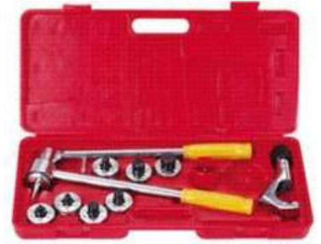
CT-100A KIT EXPANSOR MANUAL INCLUYE CORTADORA Y ESCARIADOR