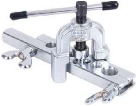
CT-195A PESTAÑADORA 3/16" A 5/8"

LINEA COMPLETA DE HERRAMIENTAS PARA REFRIGERACION