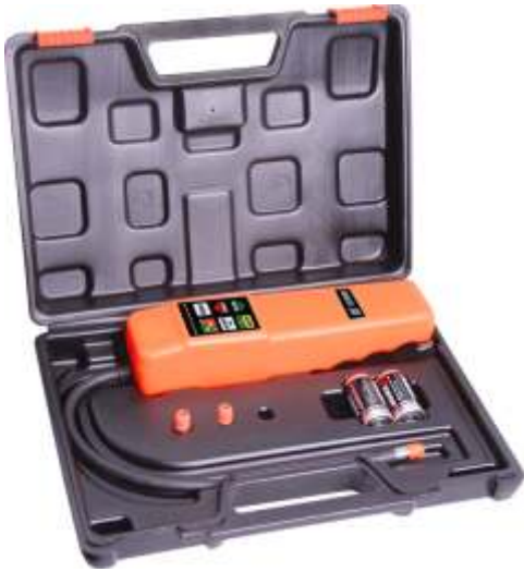
CT-CPU02 DETECTORA DE FUGA ELECTRONICA

DETECTORA ELECTRONICA CONTROL POR MICROPROCESADOR 6 NIVELES DE SENSIBILIDAD MAXIMO 3 GMS X AÑO COMPATIBLE CON TODOS LOS GASES R12 R22 R134 INCLUYE MALETIN