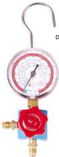
CT-1 ANALIZADOR DE 1 VIA

SISTEMA DE VALVULA CON CIERRE POR DIAFRAGMA QUE ELIMINA LOS ERRORES DE MEDICION.