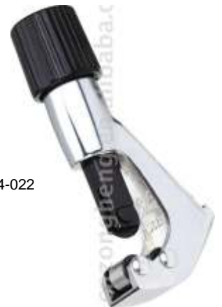
CT-274 CORTADORA DE CAÑO 1/8" A 1 1/8"