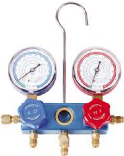
CT-2 SISTEMA ANALIZADOR DE 2 VIAS

SISTEMA DE VALVULAS CON CIERRE POR DIAFRAGMA QUE ELIMINA LOS ERRORES DE MEDICION. NO INCLUYE LAS MANGUERAS CUERPO DE ALUMINIO CON VISOR Y SOPORTES PARA LAS MANGUERAS