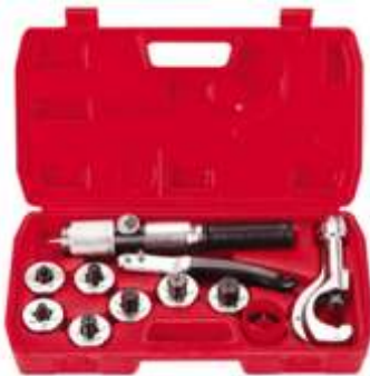
CT-300A EXPANSOR HIDRAULICO INCLUYE CORTADORA HASTA 1 5/8"