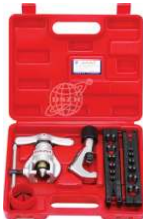
CT-806AM-L PESTAÑADORA EXCENTRICA DOBLE PUENTE

INCLUYE DOBLE PUENTE 1/4" A 3/4" Y 6 MM A 19 MM EN PRACTICO MALETIN PLASTICO CORTADORA Y ESCARIADOR INCLUIDOS