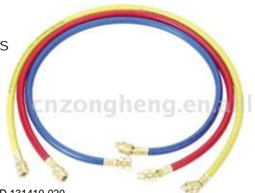
DS-60800 MANGUERAS DE CARGA X JUEGO DE 3 UNIDADES 400 PSIG 150 CMS R-410A