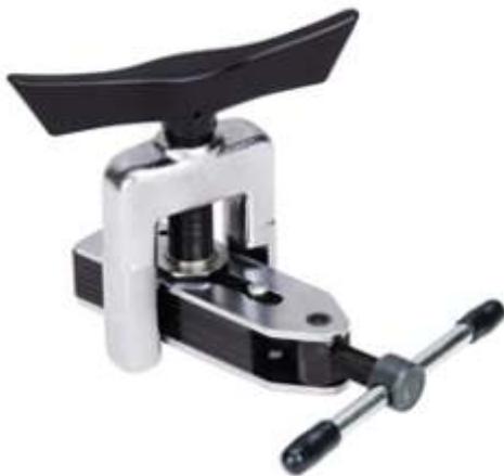
CT-525A PESTAÑADORA UNIVERSAL 3/16" A 5/8"