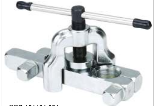
CT-103A PESTAÑADORA INDUSTRIAL 7/8" A 1 1/8"