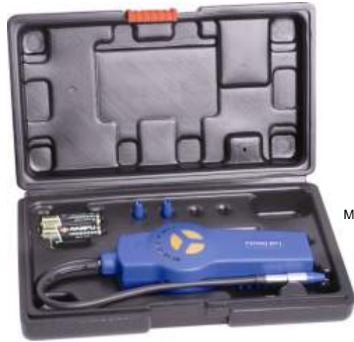
DSA-200 DETECTORA DE FUGA ELECTRONICA

DETECTORA ELECTRONICA 5 NIVELES DE SENSIBILIDAD AJUSTABLES EN 6 PASOS CADA UNO MAXIMO 3 GMS X AÑO COMPATIBLE CON TODOS LOS GASES R12 R22 R134 INCLUYE MALETIN