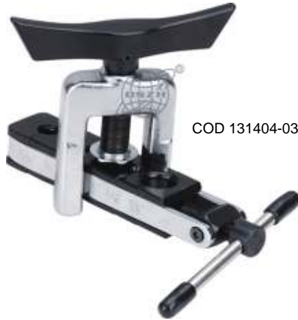
CT-500A PESTAÑADORA DE CUBOS 3/16" A 5/8"